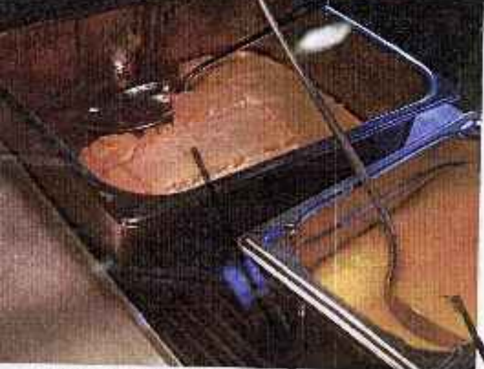
そのまゝでも、カスタードをかけた いい スポンジケーキ