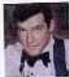
ロジャー・ムーア (第8作～第14作)