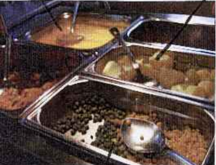
ビーンズとコーン(豆ととうもろこし) そのまゝ食べる。