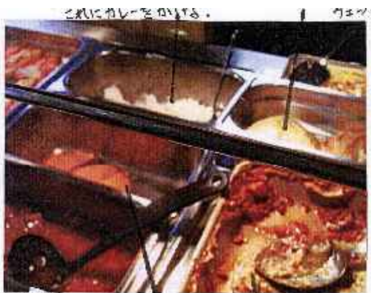
これにカレーをかける。 おいしいよ カレー 日本のとは せんべい ちがう世 ガレッジ 残りもの ラサ ニジ(ポテト)