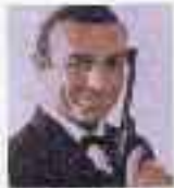
シー・V・コネリー (第1作～第5作 +第7作)