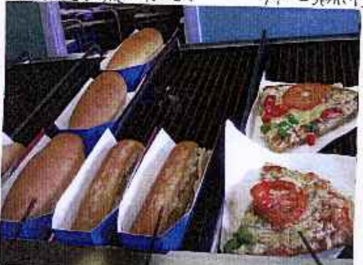
ホットドック V-セージロール (パイにマッシュポテトとセージが入ってる) 他にもいろいろあります