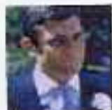
ジョージ・レイゼンビー (第6作)