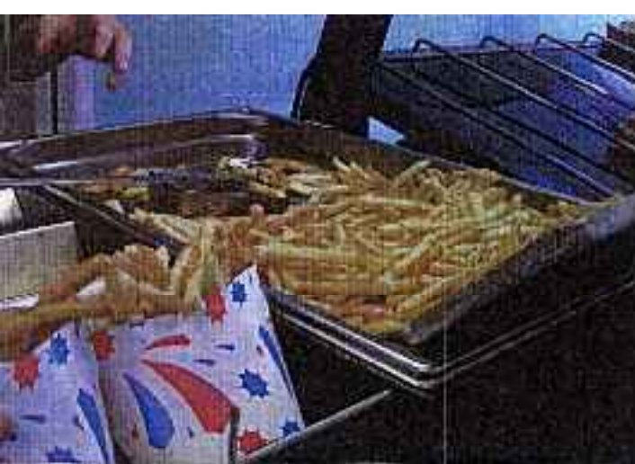
フライドポテト、イギリスにもあるよ。 マッシュポテトにポテト おいしいよ