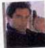
ティモシー・ダルトン (第5作, 第16作)