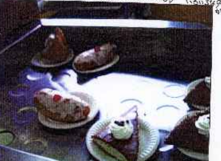
カスタード ケーキ にかけると ケーキはすごくあま〜いよ。

日本人は、最初はイギリスの料理をまずいと感じる人が多いと思います。これはイギリスの料理はイギリス人の舌にあわせて作られているからだだと思います。しかし慣れてくると「あれ？おいしい」と思う物もいっぱいあると思います。もし食べる機会があったらぜひ食べてみてください。