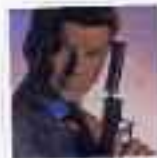
ピアース・ブロスナン (第17作～現在)